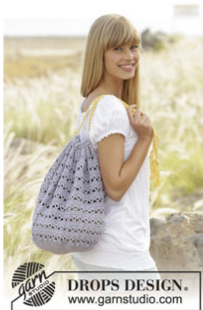
DROPS Extra 0-1298

DROPS HÆKLENÅL nr 4 – eller den nål du skal bruge for at få 18 st x 9 rækker på 10 x 10 cm.