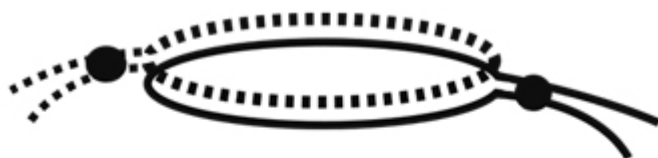
Diagram til DROPS Extra 0-1298

★ = sidste omg på bunden, omg er allerede hæklet